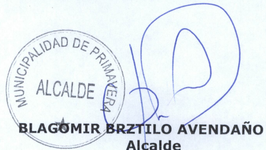
BLAGOMIR BRZTILO AVENDAÑO Alcalde