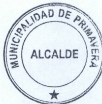
BLAGOMIR BRZTILO AVENDAÑO Alcalde