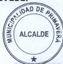
BLAGOMIR BRZTILO AVENDAÑO Alcalde