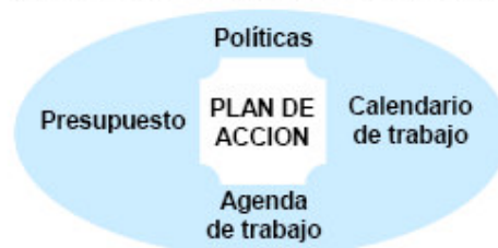
Plan de acción (SECTUR, 2002)

Las políticas son las acciones concretas para alcanzar los objetivos particulares emanados de las estrategias y diseñados en el proceso de planeación; las políticas son guías que orientan la administración y toma de decisiones. Además son la última parte del diseño estratégico. Por su importancia, las políticas deben ser cuantificables, medibles, programables en el tiempo, susceptibles de presupuestar y permitir su asignación entre los distintos responsables de su ejecución.