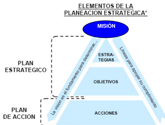
Elementos de la Planificación Estratégica (Adaptado de SECTUR, 2002)

La planificación estratégica se puede visualizar de la siguiente manera: